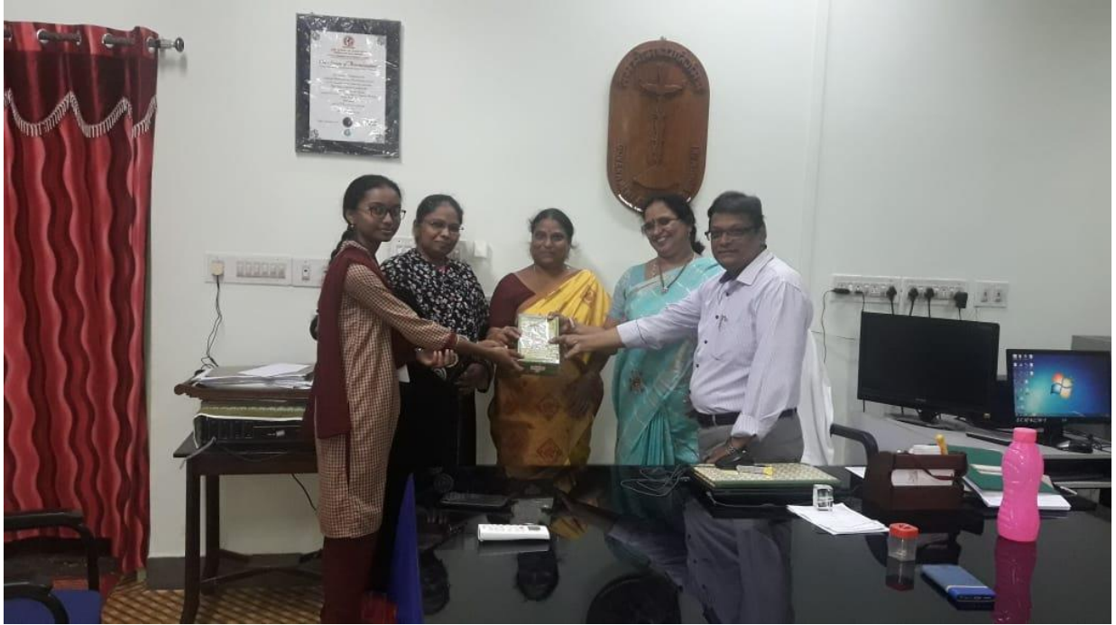
Elocution competition conducted by District Library Guntur