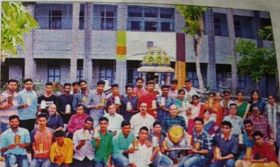
హిందూ కళాశాల విద్యార్థులతో అధ్యాపకులు